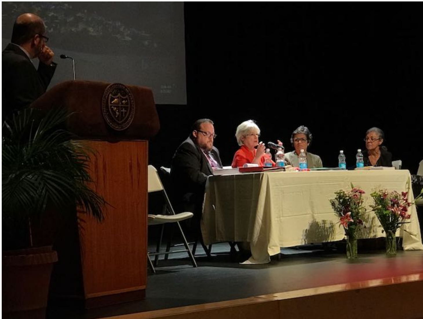
Plenaria en el Simposio Código Civil de CABA.

Integrantes del Comité Amplio para la Búsqueda de Equidad (CABE) denunciaron el proceso atropellado y a puertas cerradas para crear un nuevo Código Civil en la Isla.